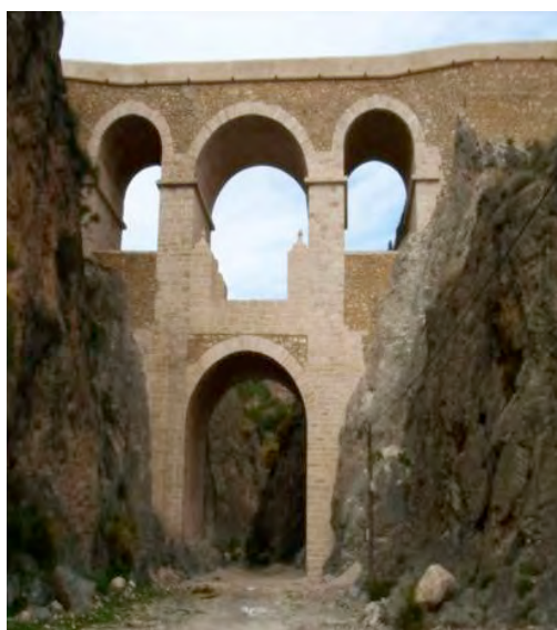
Figura 2. La Puente.

Loma de la Galera , declarada Bien de Interés Cultural en 25 de mayo de 1993 (3), por localizarse en una loma una importante necrópolis megalítica. Se distinguen en ella otros importantes enclaves como el Castillo de los Castillejos , que se yergue sobre un montículo al pie del Cerro Milano, que constituye un modelo de fortaleza rural de retaguardia árabe que fue construido entre 1275 y 1325 (4). Fue declarado Bien de Interés Cultural, con categoría de Monumento en 25 de junio de 1985, según lo dispuesto en el artículo 15, punto 1 de la Ley 13/1985 de Patrimonio Histórico Español (5). Por último es destacable La Puente , de origen romano construido sobre la rambla del río Huéchar, que se utilizaba para el transporte agrícola y minero de los yacimientos de la Sierra de Gádor y que en época de Carlos III se reconstruyó estando estructurado en dos cuerpos, el primero sobre el cauce del río está conformado por un arco de medio punto y el segundo está compuesto por tres arcos siendo el central de mayor tamaño que los laterales. En el interior del vano central del segundo cuerpo destacan unas prominentes impostas y cuatro plintos contrafuertes rematados por bolas en su interior. En uno de sus frentes destaca la inscripción 2 de agosto de 1807. Ha sido restaurado entre 2004 y 2007 (Figura 2).