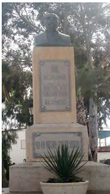
Figura 4. Monumento a Nicolás Salmerón Alonso.

- Nicolás Salmerón Alonso (1837-1908). Proyectó las ideas del krausismo en la política española e intentó encauzar el republicanismo de finales del siglo XIX y principios del XX por la senda del parlamentarismo. El Sexenio Democrático le deparó el mejor momento de su vida política al acceder a la presidencia del poder ejecutivo de la Primera República Española. Era de salud precaria y le gustaba aprovechar sus vacaciones para ir al Balneario de su tierra natal, motivo por el que se construyó una villa (6). Una Avenida y la Biblioteca Pública Municipal recuerdan su nombre (Figura 4).