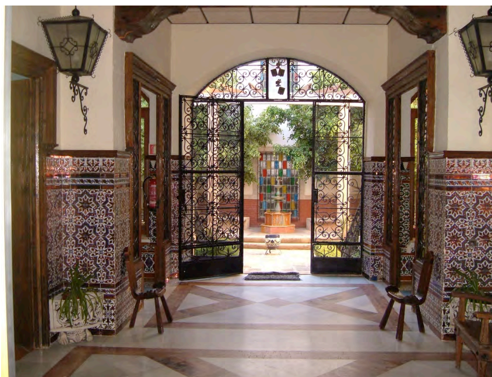
Figura 8. Pasillo con azulejos y patio interior del Balneario de San Nicolás.

Los pasillos son muy amplios y están decorados en la parte inferior con hermosos azulejos conservándose todavía en la plantas inferiores los antiguos (Figura 8) mientras que en la última planta son de factura moderna. En estas zonas de paso se han empleado en la decoración los cabeceros de las camas antiguas que son de madera rústica y tienen tallado a la derecha un racimo de uvas y a la izquierda un sol, aludiendo a la riqueza agrícola de la población que además goza de un microclima excepcional con noches frescas en verano.