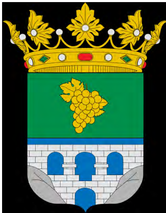
Figura 1. Escudo heráldico de Alhama de Almería.

Balneario puede hacerse por ferrocarril hasta Almería, en autobús ALSA hasta Almería o bien en avión hasta Almería y desde Almería en autobús ALSA a Alhama de Almería.