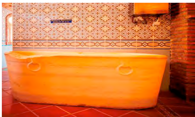
Figura 5. Bañera de origen romano.

En 11 de mayo de 1874 la pujante burguesía local, gracias a involucrarse en negocios vitivinícolas y mineros, constituyó la Sociedad de Baños de San Nicolás, que contaba con 160 accionistas, que se repartían 400 acciones con el fin de costear la construcción y explotación del Balneario que finalmente fue abierto en 1877 y que se convirtió en el principal punto de vida social del municipio.