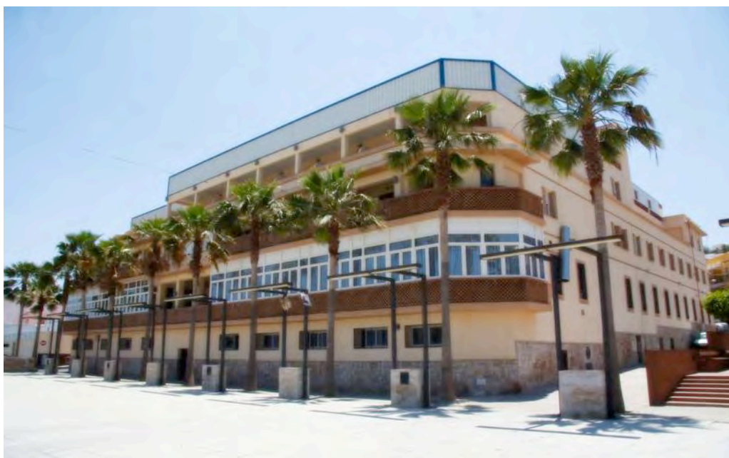
Figura 7. El Balneario de San Nicolás en la actualidad.

El Balneario dispuso de hospedería para los bañistas contando en 1878 con 9 habitaciones, aunque los bañistas podían optar por hospedarse en un fonda que existía enfrente del Balneario en la misma calle, a unos 100 metros; o en casas particulares. En 1880 el Balneario tenía 26 habitaciones y en 1927 alquilaba habitaciones que estaban provistas de cocina, despensa y dormitorio.