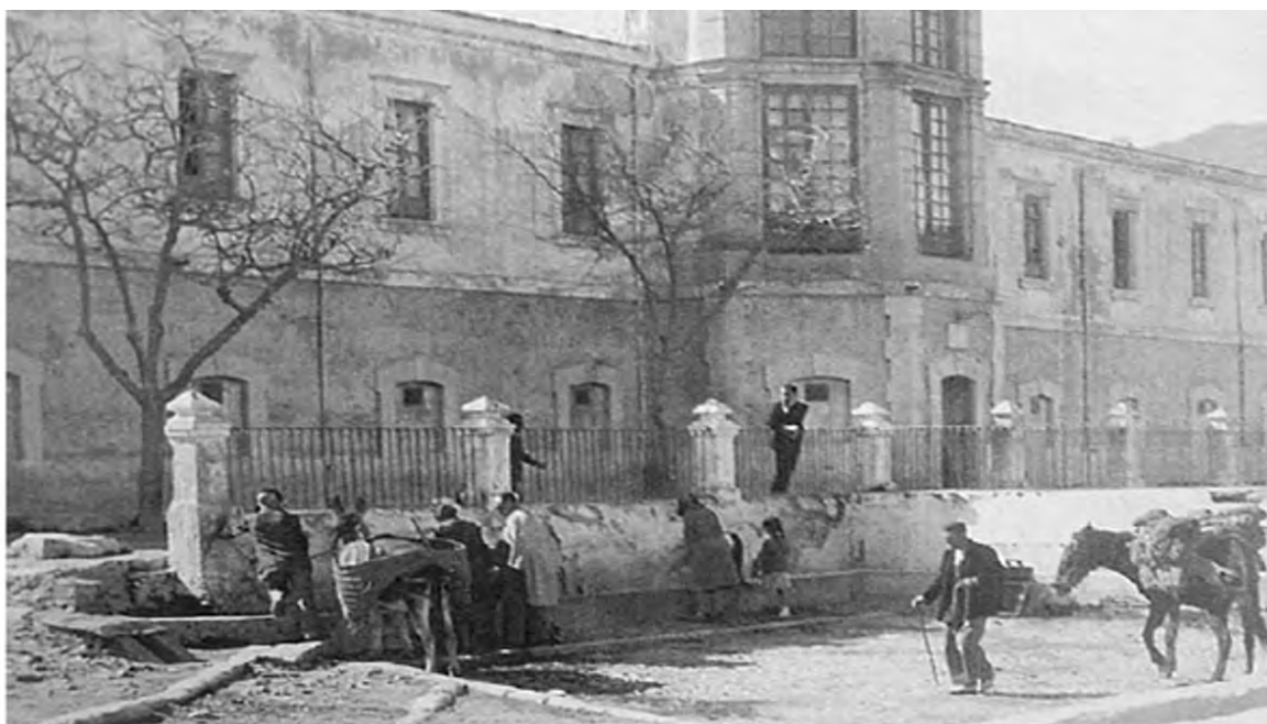
Fuente del balneario de San Nicolás (Alhama de Almería) a principios del siglo XX. Fotógrafo desconocido, colección particular familia Barquero Artés. Fuente: AMATE (2007: 369)