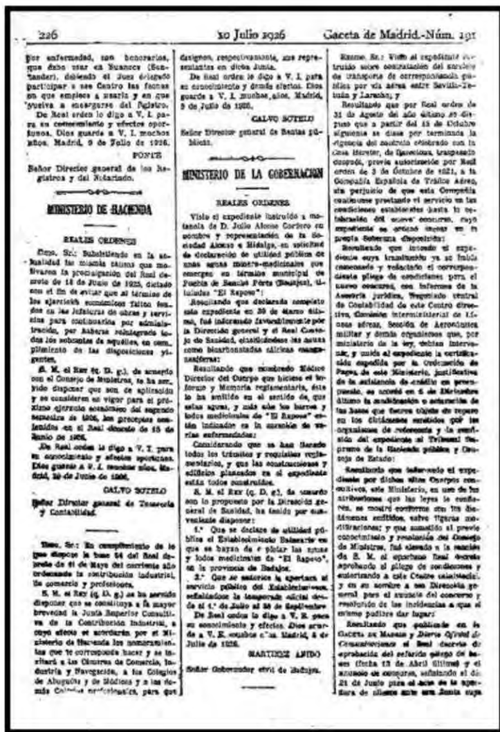
Figura 4.- Real Orden de 8 de julio de 1926 declarando de utilidad pública las aguas mineromedicinales del Balneario

D. Diego Hidalgo Durán (Figura 5) (16) era natural de Santos de Maimona adonde regresaba en la temporada estival para disfrutar en aquel “oasis del esparcimiento en el desierto de la monotonía de la vida de los pueblos” (17).