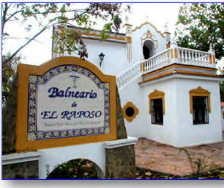
Figura 6.- Entrada al Balneario El Raposo.

ampliando de 1 de marzo a 30 de noviembre, después se fijó del 22 de febrero al 15 de diciembre, más tarde del 1 de febrero a 21 de diciembre.