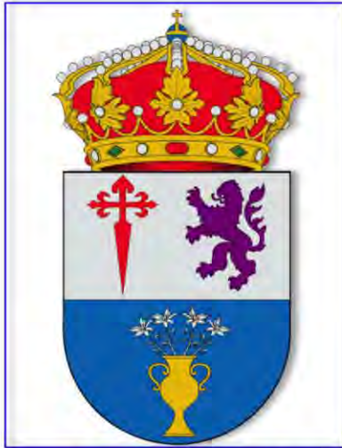
Figura 2.- Escudo heráldico del Municipio de Puebla de Sancho Pérez.

rampante de púrpura. En el segundo, de azur, lleva un jarrón de oro sumado de azucenas de plata. El timbre consiste en una corona real cerrada. (2) (Figura 2).