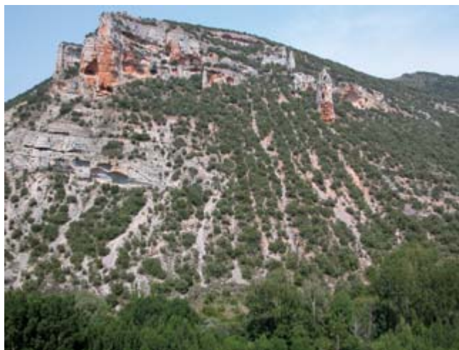
FIGURA 6. Carrascal de Buxo sempervirentis-Juniperetum phoeniceae sobre roquedos y pedrizas. Sobrepeña, Pesquera de Ebro.

Buxo sempervirentis-Juniperetum phoeniceae ( Rhamno lycioidis-Quercion cocciferae , Pistacio-Rhamnetalia alaterni , Quercetea ilicis ). Área: 100 m 2 . Cobertura: 50. Altitud: 632 metros s.n.m. Número de