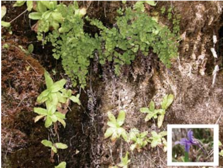
FIGURA 7. Vegetación brio-pteridofítica de Hyperico numularii - Pinguiculetum coenocantábrica . Valdelateja.

Tiene una gran vistosidad, aunque la presencia de estas comunidades brio-pteridofíticas están muy localizadas; colonizan paredes y peñascos rezumantes donde fluyen aguas carbonatadas durante todo el año, originando precipitaciones calcáreas sobre los restos vegetales, dando lugar a las tobas y travertinos. Se presentan en Orbaneja del Castillo, Tubilla del Agua y en las proximidades del Balneario de Valdelateja. Están dominadas por los hemicriptófitos Adiantum capillus-veneris , Hypericum nummularium , Pinguicula grandiflora subsp. coenocantabrica y briófitos, como Eucladium verticillatum y Pellia fabroniana (Figura 7).