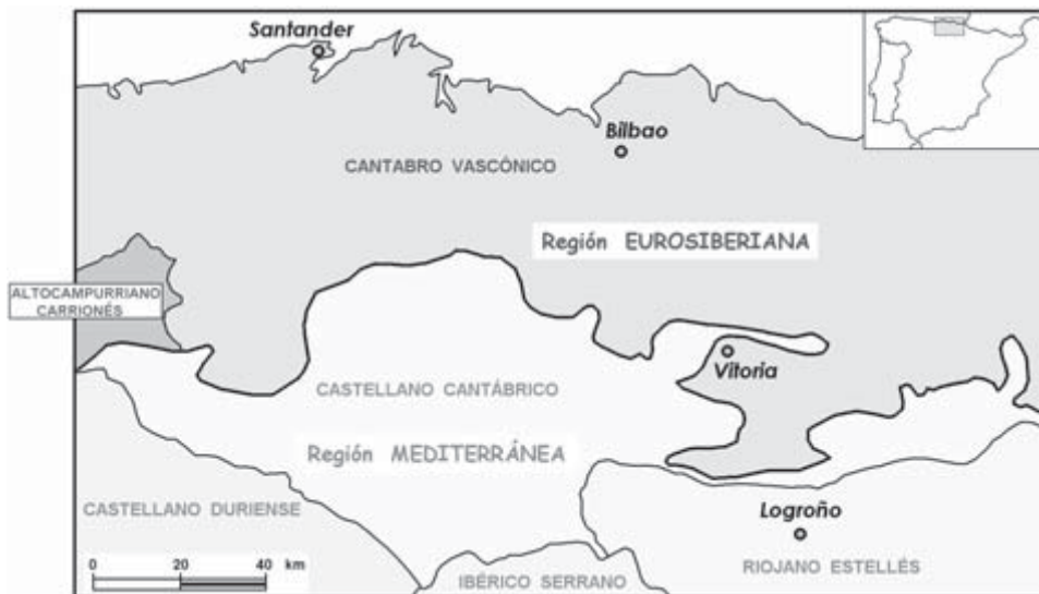
FIGURA 2. Mapa biogeográfico del Sector Castellano-Cantábrico.