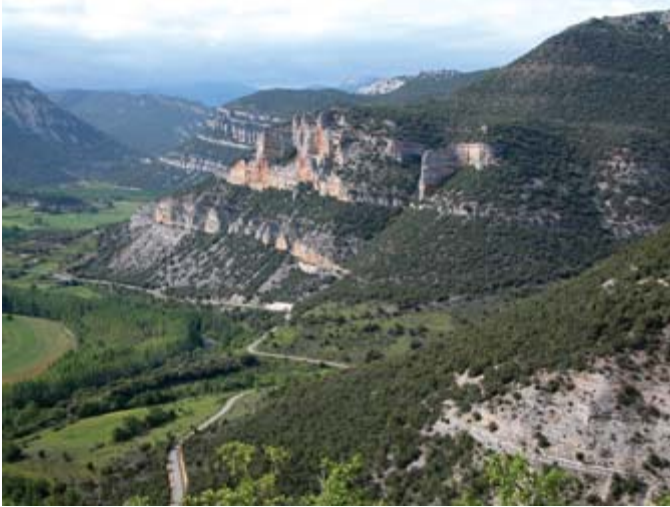
FIGURA 1. Vista parcial del Valle de Sedano, Cañón del Río Ebro.