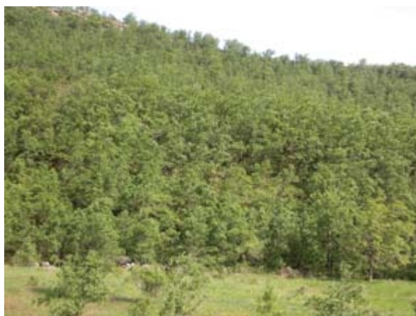
FIGURA 4. Quejigar de Spiraeo obovatae-Quercetum fagineae. Ladera del Crucero, Valdelateja.

Se trata de un bosque denso casi impenetrable incluso para los animales salvajes; los suelos son profundos y eutrofos. Esta formación vegetal ocupa en el territorio menor extensión del que le correspondería, por estar los suelos en las mesas y páramos dedicados al cultivo cerealista. Sólo las laderas en exposiciones de umbría, por debajo de los 800 metros, albergan este tipo de bosque. Son suelos del tipo de tierra parda eutrofa y suelos pardo calizos, generados sobre margas del Cretácico superior (Figura 4).