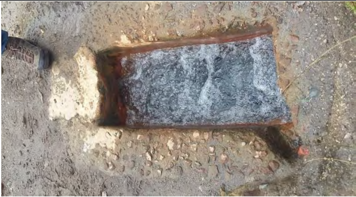
Figura 4. Tanque de almacenamiento de agua termal que surte la piscina termal del Balneario “Piscinas El Cachaco”.