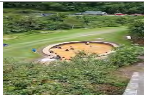
Figura 2. Fotografía del Balneario “Piscinas El Cachaco”.

El balneario cuenta con una piscina de agua termal con una temperaturas de 25 °C a 27 °C. El agua termal llega a una cámara antes de llegar a la piscina. Las instalaciones se encuentran dentro de un sector rodeado por vegetación, y presentan un pequeño riachuelo en donde es descargada el agua de las piscinas sin previo tratamiento antes de su disposición, a esta fuente se drena sólidos, lodos y agua que ha sido almacenada en las piscinas durante 4 días de uso del complejo, debido a que el mantenimiento se realiza entre semana para no perjudicar la visita de los pobladores y visitantes (Figura 2).