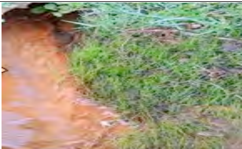
Figura 3. Punto de emergencia del agua termal que surte el Balneario "Piscinas El Cachaco".

Una vez comprobada la diferencia de la temperatura, se recurrió a un plan de muestreo que consistió en escoger tres zonas, donde se realizaron tomas de muestras en seis ocasiones diferentes a una razón de tres muestras por año, para un total de dieciocho muestras. Las muestras fueron: agua del punto de emergencia del manantial que alimenta al balneario, del tanque de almacenamiento que alimenta a la piscina termal y de la piscina termal (Figuras 3-5).