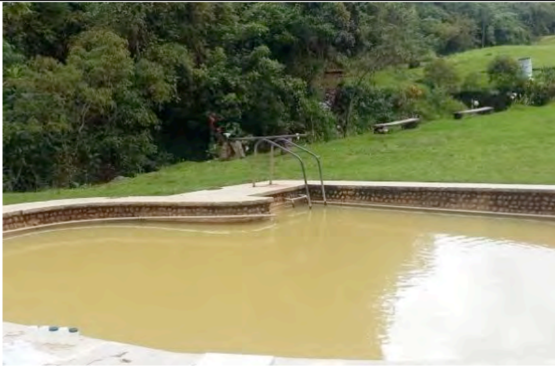
Figura 5. Piscina termal del Balneario “Piscinas El Cachaco”.